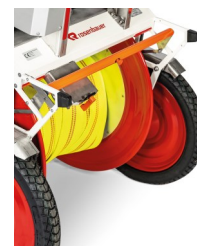
Gummipuffer für das Niederlegen