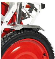
Bremsbacke unter Kotflügel