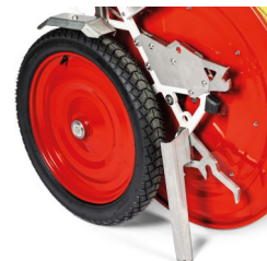
Abstellfuß, zum sicheren Abstellen