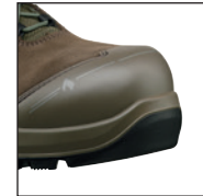
HAIX® Nano-Carbon Schutzkappe